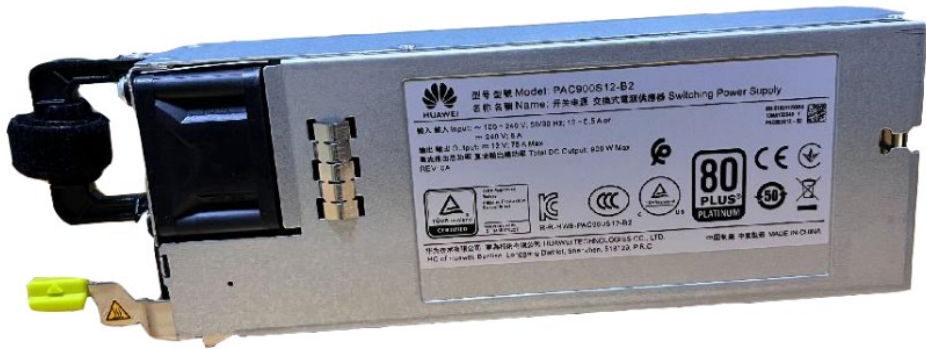
图5-1 电源模块 1